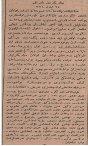
Ek 1: Diyarbakır'dan gönderilen telgraf Sabah, No: 8280, 26 L. 1330/8 Ekim 1912.

ولایتیزده مدافعه ملیه جمعیتی ولایتیزدهده بوکره برمدافعه ملیه جمعیتی بوجه اتی تشکل ایتش و بو باده کی اوراق ونظامات وارده دخی طرف عالی ولایتینا هیدن پانذ کره رسمیه کند یارینه تودبع بیورنش در شبان منور مزدن متشکل اولان شو جمعیتی تبریک و دوام و توالی حسن موقعتیلرینی تمنی ایدرز . رئیس : پرنجی زاده فیضی بک اعضا : بلدی رئیس کامل اقدی • مکتوبه بجزی ولی نیرت بک • زلفی زاده عادل بک • طربان بیان او هانس اقدی • قزاز یاز دیرن اقدی